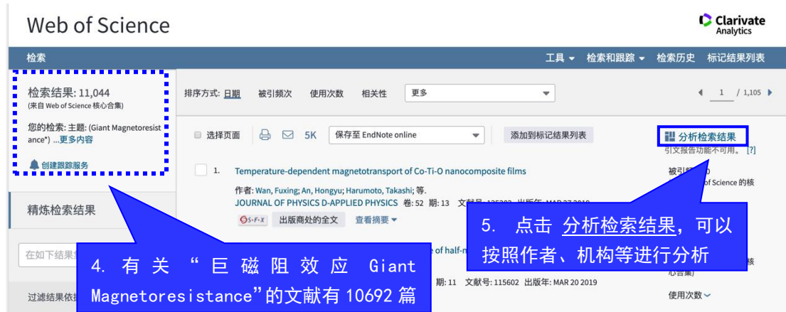
图 2 检索结果界面

在检索结果界面上，通过右上角的“分析检索结果”功能您可以快速了解该课题的 Web of Science 类别、文献类型、作者、机构、国家等信息。见图 2、图 3。