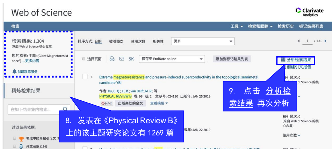
图 4 二次分析检索结果