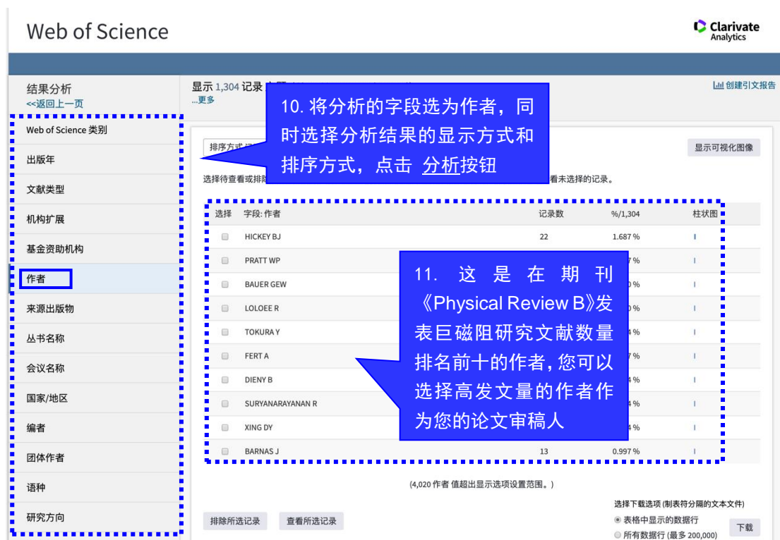
图 5 二次分析检索结果——按作者