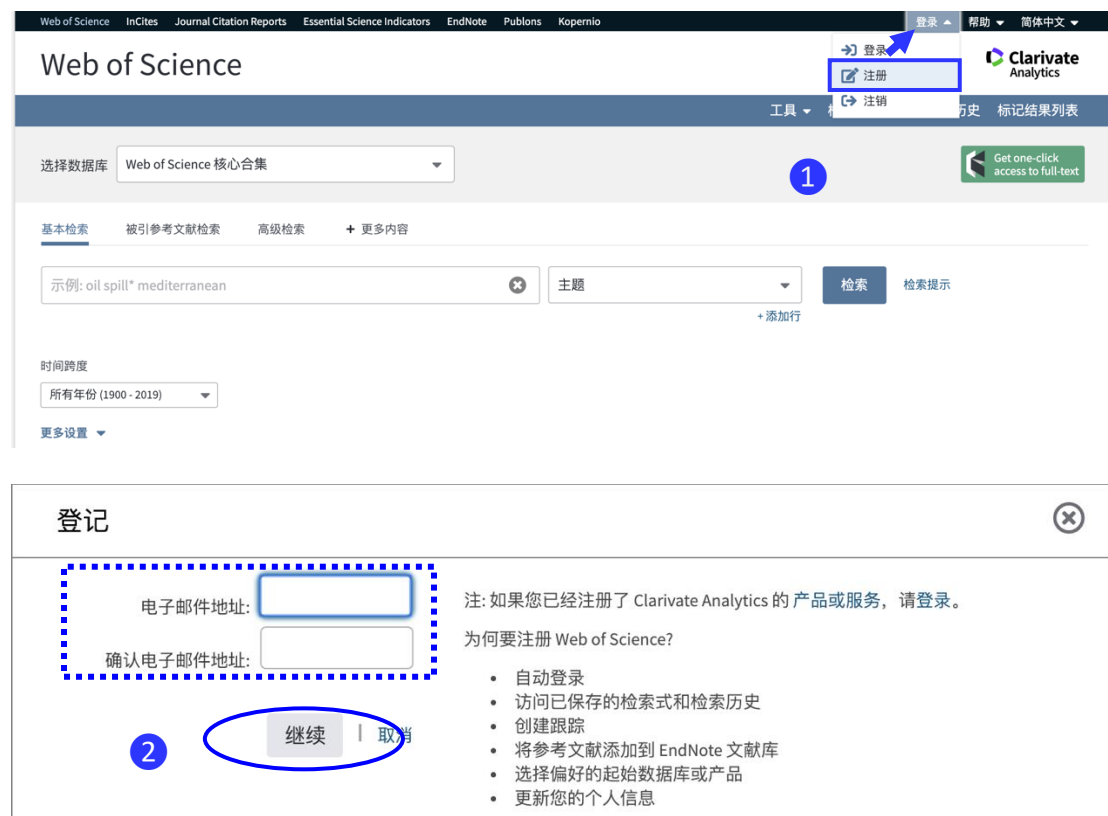
图 1 注册