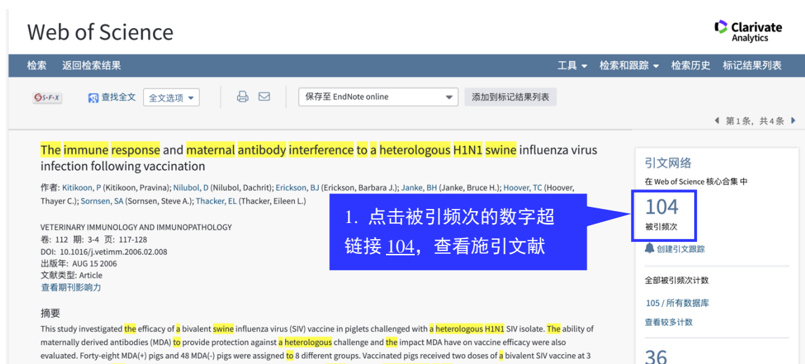
图 1 点击查看当前论文施引文献

例如：我们想查找 2006 年发表的一篇关于 H1N1 猪流感的论文的施引文献，进一步分析（见图 1）。