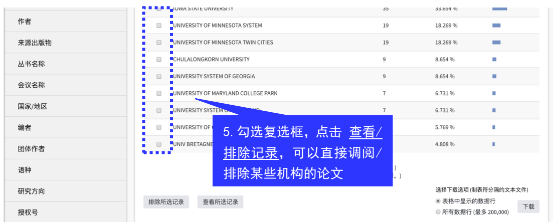
图 4 勾选复选框，可以查看某些引用机构的论文