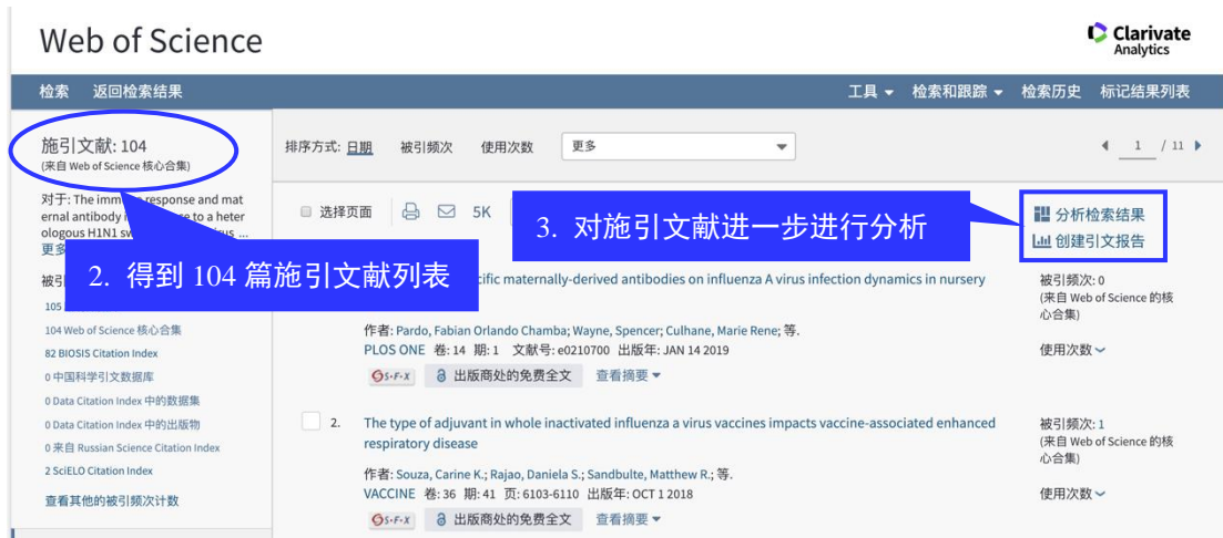
图 2 施引文献列表