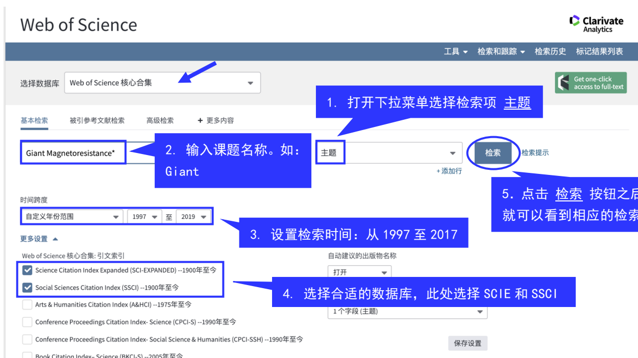
图 1 设置检索条件

请访问： http://webofscience.com 进入 Web of Science™ 平台；选择 Web of Science™ 核心合集，设置检索条件，如图 1 所示。