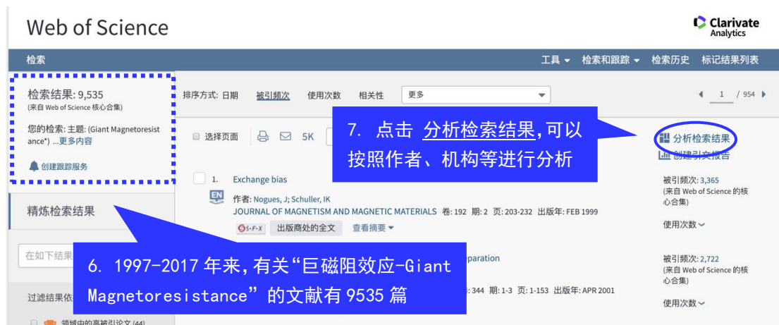
图 2 检索结果页面—“分析检索结果”